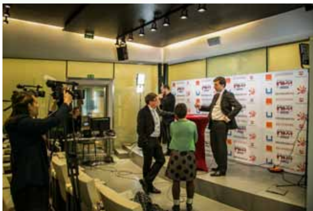
plateau de tournage pendant le Colloque NPA-Le Figaro

toutes les vidéos et la revue de presse complète sont disponibles sur www.colloque-npa.fr