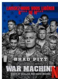
TOP 5 des programmes SVoD ayant bénéficié des plus importants investissements publicitaires en 2017

Si les investissements publicitaires spécifiques aux contenus étaient jusqu'à récemment réservés aux séries télévisées, Netflix investit désormais également pour promouvoir ses films exclusifs. Ainsi, deux films ( War Machine et Bright ) occupent respectivement la 1ère et la 3 e place du classement des titres qui ont le plus bénéficié d'investissements publicitaires en 2017. Cette évolution montre une nouvelle fois le changement progressif de stratégie chez Netflix qui ne mise plus seulement sur les séries originales mais également sur ses films pour attirer de nouveaux abonnés.